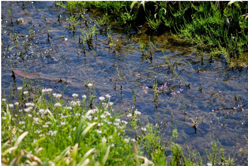
清らかで美しい希望へ

退院して3か月半がたった。クリニックとスタッフは一見すると変わらない。大活躍だった産婦人科新米長男は大学病院へ戻っていった。産婦人科3年目の4女は妊娠が発覚しドタバタの後自宅でのんびりしている。骨折り損のくたびれ院長は骨折そのものの経過は良好で心配していた偽関節の発生もない。リハビリは難航。相変わらず夜間の痛みで目が覚める。復活度は甘く見積もっても4割程度か。恐怖と邪悪の、それぞれに満ちた暗黒のトンネルを合計2つも通り過ぎようとしている。ようやく向こうに出口の明かりが見える。そうだ、根本的に何かが変わった。真の転機だ。以前の自分にはもう戻れない。たしか骨折する数日前、息子や娘を目の前に「指揮官先頭だ、みんなついて来い！」みたいなことを安いワインの勢いでしゃべった記憶がある。今は歩くのも妻を盾にするのが精いっぱいだ。天は不埒な者を見逃さないのだ。腐った骨に潜むひねたICチップの奏でる雑音はもう聞こえない。そよ風と共にあらゆる膿は消え去り、そしてきれいな空洞が残った。これからは空洞に少しずつ清らかで、美しい希望が満ちてゆくことを願う。肩をすくめて歩くから腕が上がらない、とリハビリの先生にいつも注意を受ける。心はうつむき、肩だけは春風を切って大いに歩こう。もちろん大手を振って。